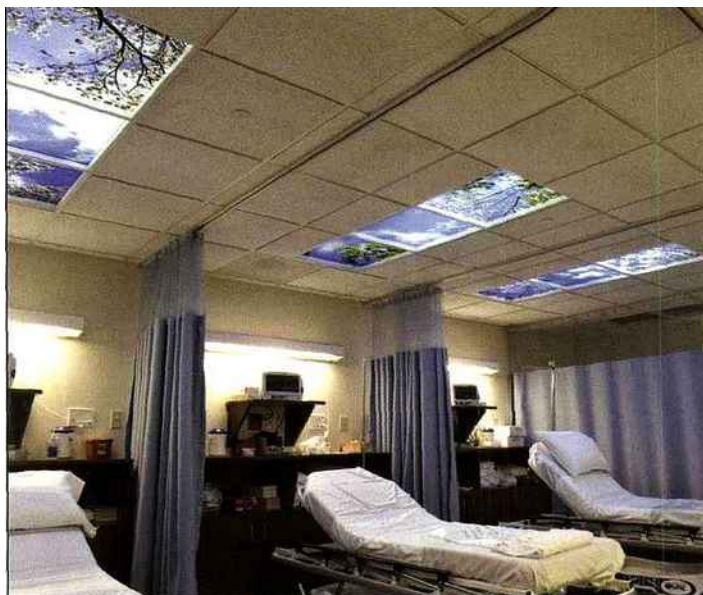
Salle pré et post opératoire, Mississippi Valley Surgery Center, Davenport, Iowa, États-Unis